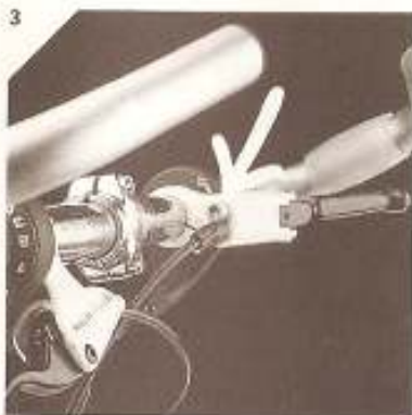
3 Remhendel zo draaien, dat de ontluchtingsschroef op het hoogste punt is en de inbuschroeven of de TPA terugdraaien (zie leiding afkorten).

Is de verbindingleiding beschadigd, nieuwe leiding afsnijden en nippels volgens de afbeelding erin slaan. Is de hoofdleiding beschadigd, deze vervangen en het systeem opnieuw bevuilen.